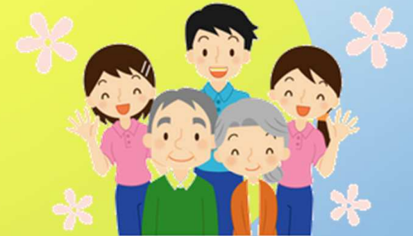
ふじしろデイサービス

定期的(半年に1回)に開催して、情報を共有したり、意見交換をしたりすることで、地域全体で介護サービスの質の向上を実現していく。