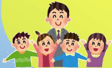
三島市(包括)、有識者