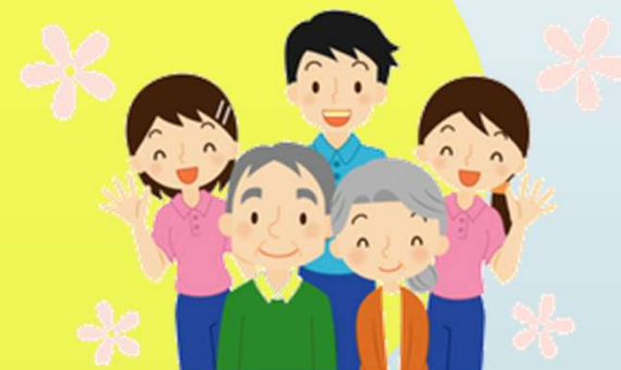
デイサービス山風木

定期的(半年に1回)に開催して、情報を共有したり、意見交換をしたりすることで、地域全体で介護サービスの質の向上を実現していく。