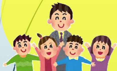
三島市(包括)、有識者