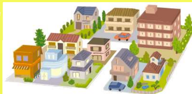
旧三島地区(加屋町)