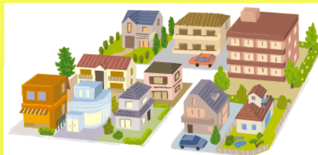
旧三島地区(加屋町)